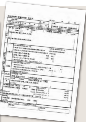
生活習慣病 療養計画書 初回用

日々の生活習慣によって改善することも、重症化することもあるこの生活習慣病ですが、単にお薬を飲むだけでなく、継続的な病状の評価や定期的な検査、お薬の調整、食事・運動などの指導が必要... 令和6年6月より政府による医療費の改定が行われ、血圧、体重、食事、運動などに関する指導内容を記載した療養計画書を用いた診療を行うこととなりました。また、これに伴い対象の患者さんの医療費の窓口負担額が変更となります。ご不明な点があれば、どうぞ遠慮なく受付窓口にてお尋ねください。