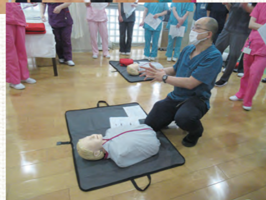
▲今回のシナリオに合わせたBLSのデモンストレーション