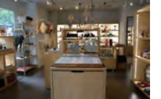
①「NONE TOO SOON」は2018年2月にオープン