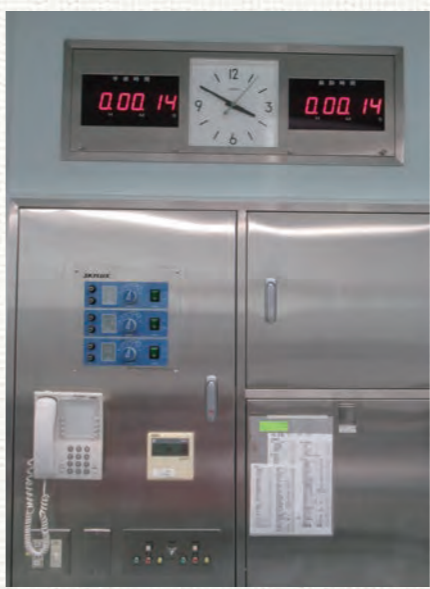
▲手術室に設置されている時計

手術で行い、手術チーム全体が連携を取りながら患者さまの安全を確保しています。皆様も手術を受ける際には、安全な環境で行われること、チームワークの良い病院で行われることを望まれると思います。