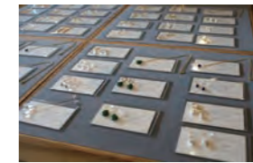
②天然石を使った「ラゴラトリウム」のアクセサリーは人気商品のひとつ

雑貨好きな方や作家ものが好きな方はもちろん、近年はSNSなどで口コミが広がり、国内だけでなく海外からのお客様も多いそうです。作家さんの作品は1点ものばかりなので、訪れる度に素敵な出会いがあるのも同店の魅力。ぜひ一度、足を運んでみてください。