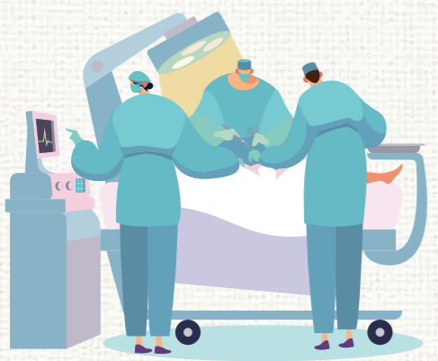
▲タイムアウトチェックリスト

先日、とてもうれしい出来事がありました。それは術後訪問を行った際、患者さんからの「この手術室の方は親切に説明してくれて、皆さんが声を掛け合っていて本当に安心できました。この病院で手術を受けてよかったです」というお声でした。私たちの日々の努力がきちんと患者さんに伝わっていることが実感できました。これからも安全な手術を行うことを目指して患者さんやそのご家族のお役に立てるよう、努めて行こうと思います。