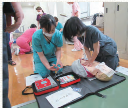
◀シナリオに沿って実際にBLSの訓練をしている様子